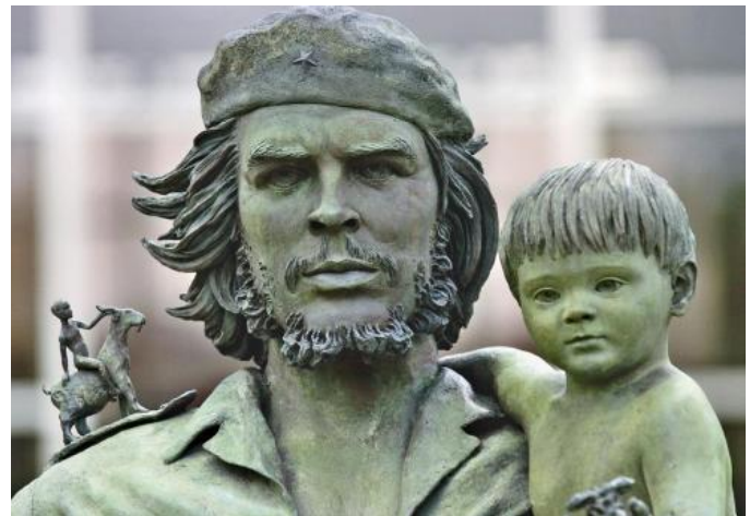
El Che con un niño en el brazo, (Casto Solano Marroyo, 1997, standbeeld in brons)